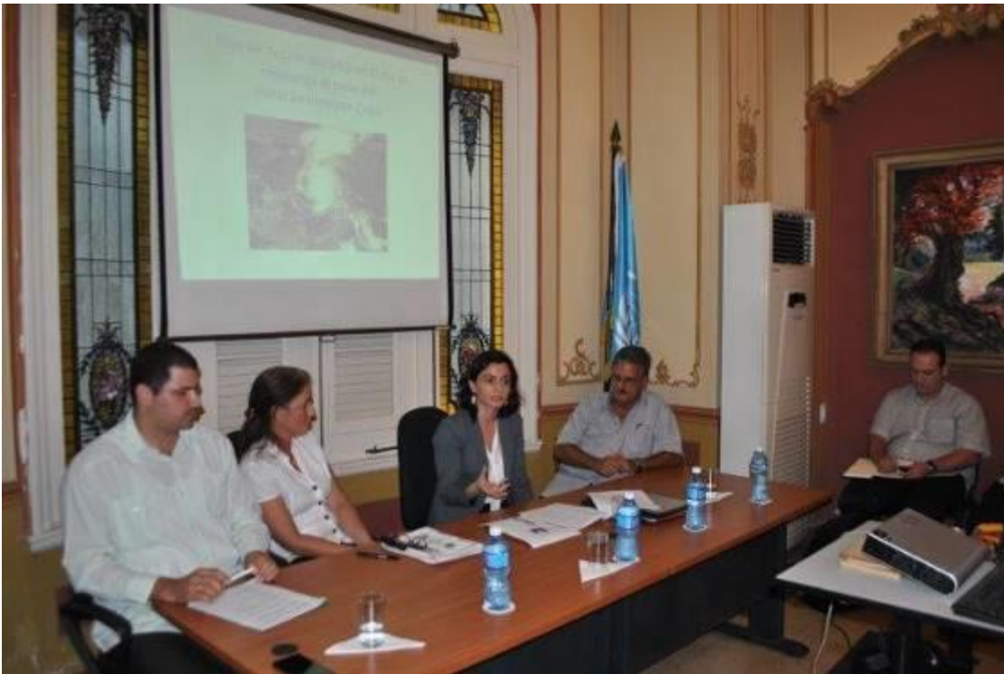
Presentación del Plan de Acción del SNU post Irma en la Asociación Cubana de Naciones Unidas el Día Internacional de Reducción de Desastres.

Proyecto: "Apoyo a la coordinación y planificación después del impacto del Huracán Irma en las provincias más afectadas de Cuba."